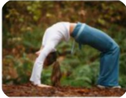
Ihre Gesundheit ist Ihr höchstes Gut. Sorgen Sie mit uns vor ...