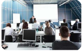
Entwicklung ist für Sie von großer Bedeutung. Wir unterstützen Sie...