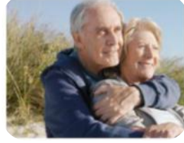
Heute an das Morgen denken und handeln – dabei unterstützen wir Sie ...