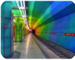
Mobil sein und bleiben ist für Sie wichtig. Unser Beitrag ist bewegend ...