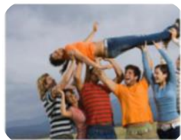
Ein „wir“ bringt uns weiter als nur ein „ich“ ...